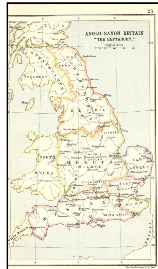
De angelsaksiske kongeriger

omfordeling af meget jordegods. I store engelske byer som York og Lincoln var den nordiske indflydelse også markant og medførte økonomisk opblomstring.