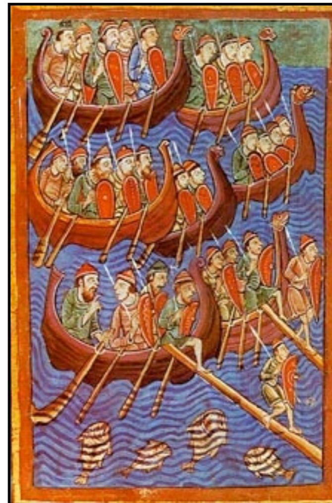
Vikinger invaderer England

De store togter i Vesteuropa ebbede ud omkring år 900, men erfaringerne hos dem, som gennem 800-årene var vendt hjem med eller uden gods og guld, må have spillet en stor rolle for nye synsvinkler på mange forhold i hjemlandet bl.a. kongemagten og den hedenske religion.