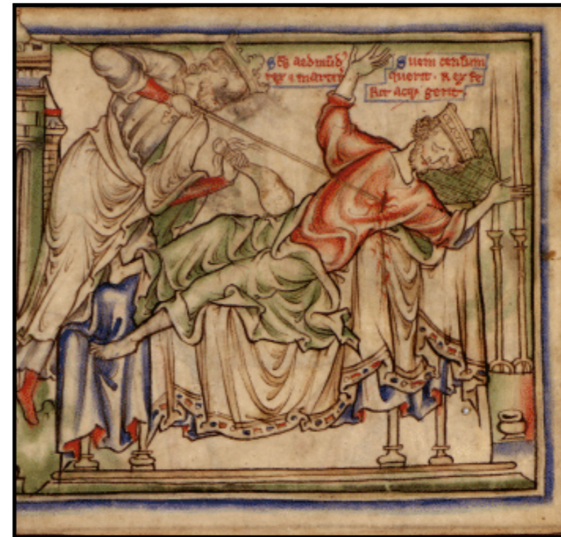
Svend Tveskægs død

I Svend Tveskægs kongetid (ca. 987-1014) skete der en militær, politisk og kulturel nyorientering mod England. Der kendes ingen store bygværker bortset fra kirker, og heller ingen markante gravmæler. Der vides i det hele taget ikke meget om aktiviteter i Danmark. De første år var præget af problemer med de slaviske lande syd for Østersøen, men fra omkring 990 var der gode muligheder for at erhverve meget sølv i England. I årene 991-1013 var der næsten hvert år togter og store udbetalinger af Danegæld derovre – ifølge samtidige oplysninger f.eks. 48.000 pund sølv i året 1012. Kong Svend deltog flere gange, vistnok første gang i 991. Ca. 995 lod han slå mønt efter engelsk forbillede med eget portræt på den ene side, kors på den anden, og med angivelse af sit eget og møntmesterens navn på latin og med latinsk skrift. Det blev indledningen til en lang periode med stærk engelsk påvirkning. I 1013 erobrede Svend Tveskæg hele England, men døde året efter.