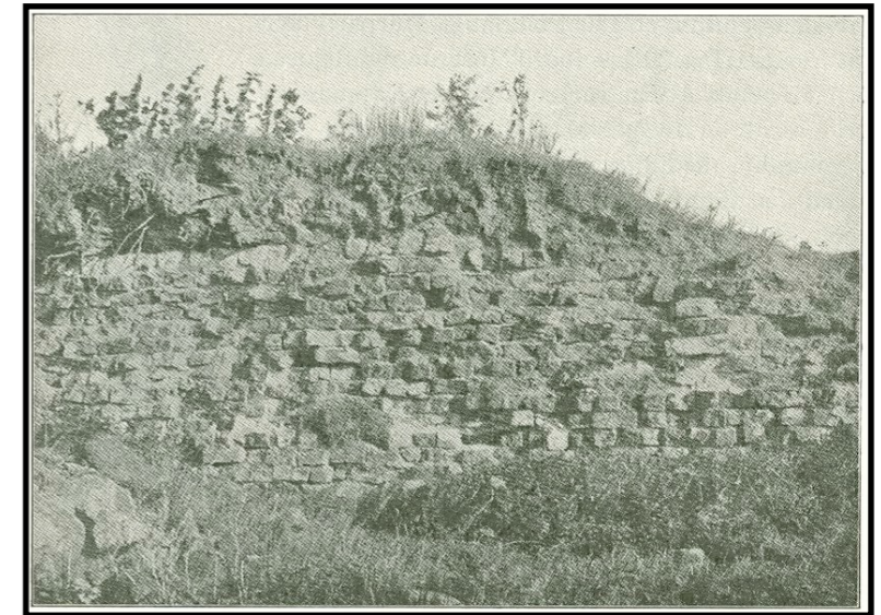
Teglstensmuren ved Dannevirke Fra Danmarks Riges Historie (1896)

men også skiftende alliancer mellem Danmark og de slaviske lande, der også var udsat for pres fra det mægtige frankiske Karolingerrige og siden Det Tyske Rige. Dannevirke blev udbygget mange gange indtil slutningen af 1100-årene og spillede en afgørende rolle i de politisk-militære forhold til magterne sydpå.