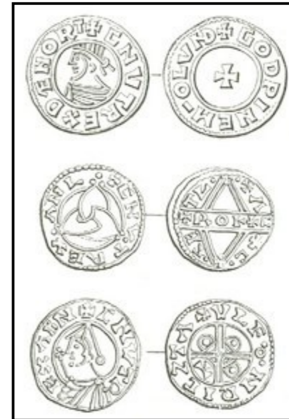
Mønter fra Knud den Stores (ca. 995-1035) tid. De er præget i Lund, Roskilde og Ringsted

Betalinger foregik nu i voksende omfang med sølv, også for små transaktioner, og under Harald Blåtand blev der slået langt flere mønter end før, selv om hovedprincippet stadig var betaling med sølv efter vægt. Det fik utvivlsomt afgørende betydning, at den store tilstrømning af arabisk sølv, som i mange år var kommet via Rusland, ret brat tørrede ud omkring 970. Nye kilder måtte findes; det blev i Vesteuropa. For skibenes vedkommende skete der senest på denne tid en specialisering i handels-fragtskibe på den ene side og krigs-rejseskibe på den anden. Årsagen må være voksende handel, fred på havet og militære behov for særligt hurtige skibe. I slutningen af 900-årene kom der også nye byer, bl.a. Viborg, Roskilde og Lund.