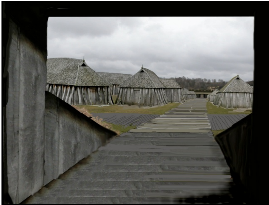
Forsøg på rekonstruktion af Fyrkat, kig gennem den nordlige port