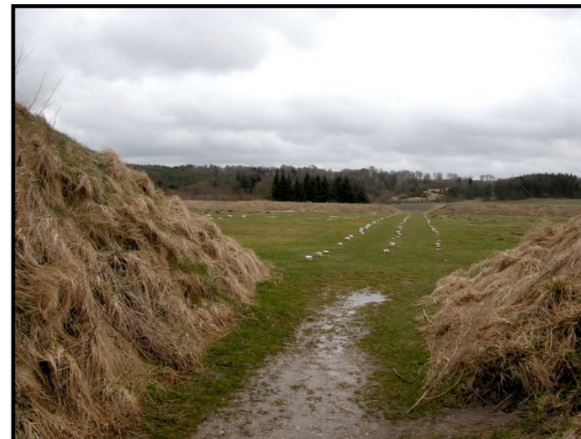
Ringborgen Fyrkat ved Hobro, opført ca. 980

store Aggersborg ved Limfjorden skulle sandsynligvis yderligere kontrollere trafikken på denne vigtige vandvej og udføre militære opgaver i forhold til Norge, hvor Harald Blåtand omkring år 970 havde erhvervet overherredømmet. Arbejdskraft til byggerierne må være skaffet ved konvertering af den almindelige forsvarspligt til befæstningsarbejde, ligesom det skete andetsteds i Europa på den tid.