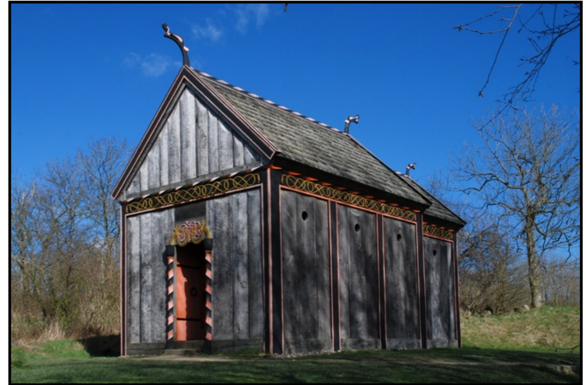
Rekonstruktion af stavkirke, Moesgård Museum

Der er få og tit modstridende skriftlige oplysninger om Danmark i første halvdel af 900-årene. Men bl.a. blev en dansk konge, Gnupa, i året 934 besejret af den tyske konge Henrik Fuglefænger og døbt, og i 948 nævnes biskoper af Hedeby, Ribe og Århus. Det er første gang Aarhus nævnes. Alle tre byer blev befæstet med en kraftig vold, Ribe vistnok i 800-årene og de andre i første halvdel eller midten af 900-årene – vel som konsekvens af urolige tider.