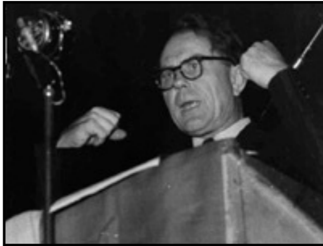
Aksel Larsen (1897-1972) stiftede i 1959 Socialistisk Folkeparti (SF) efter at være blevet ekskluderet af DKP og skabte dermed et nyt alternativ til venstre for Socialdemokratiet

konsekvenser. Partiformanden Aksel Larsen distancerede sig efter 1956 gradvist fra partiets linie og blev ekskluderet i 1958. Han stiftede herefter Socialistisk Folkeparti (SF), som gjorde det muligt at være til venstre for Socialdemokratiet uden at være