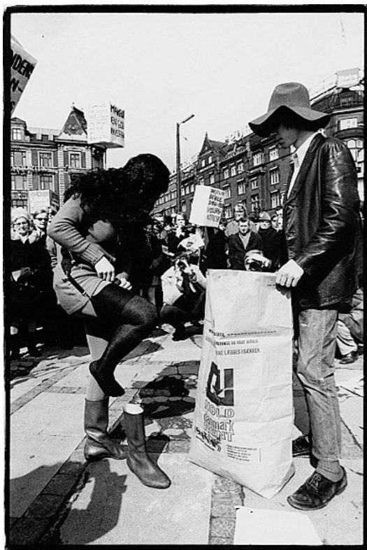
Rådhuspladsen i København 1970.