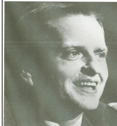
Olof Palme: Samarbejdes udvælgelse afhænger samtidig i høj grad af de deltagende landes samarbejdsvillighed. Den vilje er stadig væk, hvis man da skal domme efter det sidste møde i Nordisk Råd i Helsingfors.

»Jeg har aldrig kaldt EF en »økonomisk blok«. Jeg har derimod sagt, at muligheden i vores forhandlinger på en del områder prøver at beskytte sin egen indtækt. Det betyder, at kulturelle og tekniske samarbejder vil udvikles. Men glem ikke det politiske moment i hele EEC's udvikling. I det øjeblik, man siger, »nu skal vi have en fælles udenrigspolitik«, lakkede man deres for svensk medlemskab.«