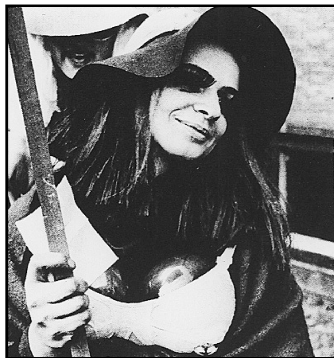
Demonstration 1970