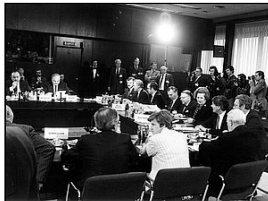
Uffe Ellemann-Jensen (V) til Europarådsmøde 1983. Fodnotepolitikken blev udløst af NATO's dobbeltbeslutning fra 1979 og blev efter det danske regeringsskifte i 1982 et centralt stridspunkt i den danske debat. Uffe Ellemann-Jensen var i kraft af sin position som udenrigsminister den, der skulle overbringe de danske forbehold på ministermøderne i NATO og til Danmarks allierede i USA

af Det Konservative Folkeparti, Venstre og Det Radikale Venstre. Det indebærer, at Det Radikale Venstre opgav fodnotepolitikken. På det tidspunkt var den internationale situation blevet langt mere afspændt. I 1989-91 brød det kommunistiske styre i Østeuropa sammen, hvilket skabte en helt ny udenrigs- og sikkerhedspolitisk situation.