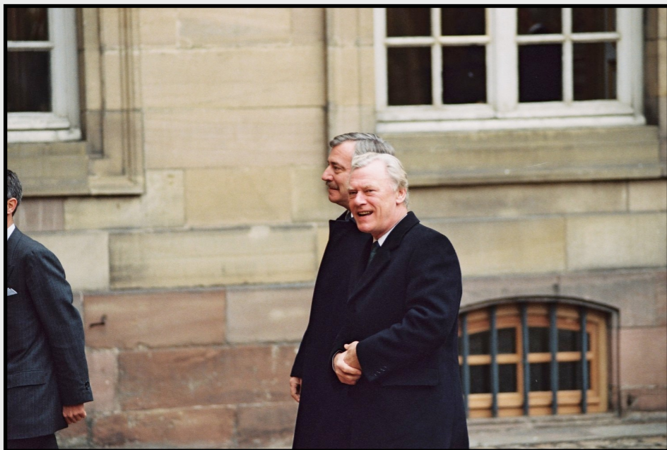
Poul Schlüter og Uffe Ellemann-Jensen til Europarådsmøde i Strasbourg i 1989

Intet afspændingsbevis vil kunne være mere troværdigt, for os end, at Sovjet trak sine invasionsstyrker ud af Afghanistan.