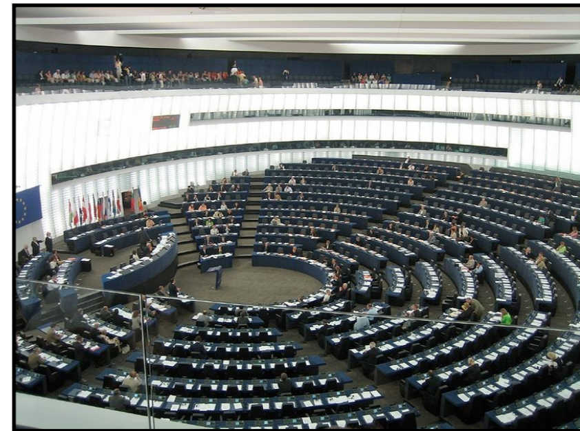
Europa-parlamentssalen i Strasbourg. Efterkrigstidens vigtigste udenrigspolitiske begivenhed for Danmark var medlemskabet af EF, der trådte i kraft den 1. januar 1973

karakteriseret af en tilbagevenden til den kolde krig. Det skabte store spændinger i Danmark mellem regering og opposition og skabte den såkaldte fodnotepolitik, hvor et folketingsflertal tog forbehold over for en række beslutninger i NATO.