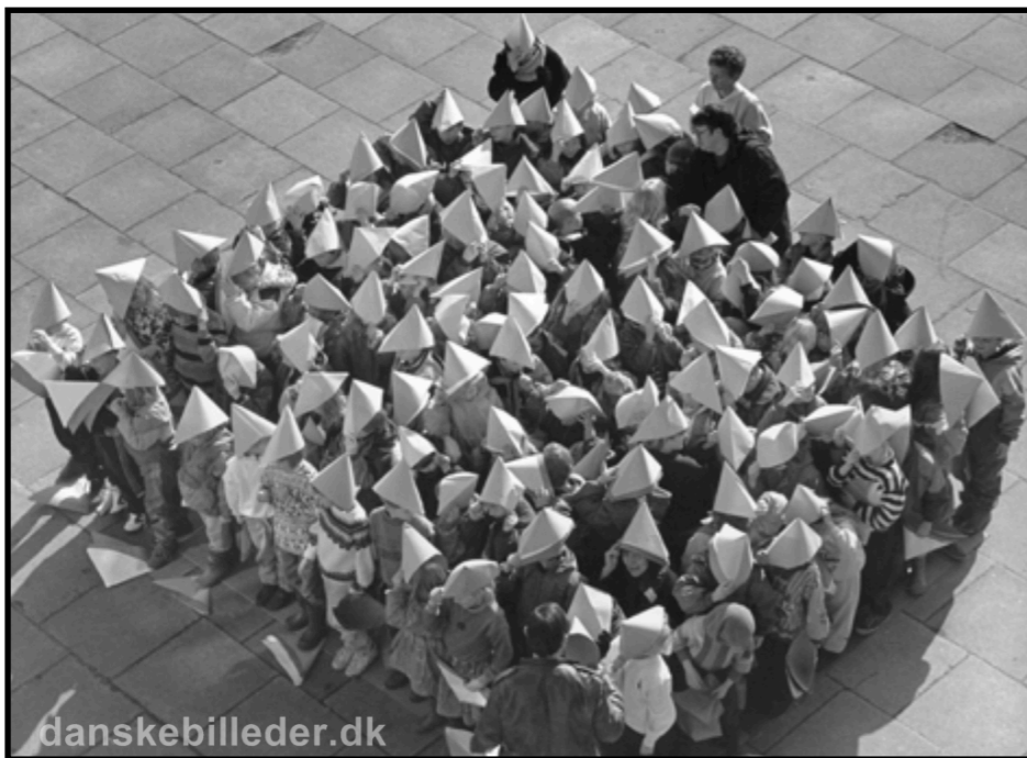
Emneuge om matematik, Silkeborg 1983. Tværfaglighed var et af de nye elementer i folkeskolens undervisning, som blev indført med skoleloven i 1975

ønskede at supplere deres skoleuddannelse, kunne følge undervisning, der kvalificerede til folkeskolens afgangsprøve eller studentereksamensniveau (HF). Det erhvervsfaglige uddannelsessystem blev reformeret med indførelsen af de erhvervsfaglige grunduddannelser, EFG, i 1977. Der blev også skabt øgede uddannelsesmuligheder for specialarbejderne, fra 1990 samlet i Arbejdsmarkeds Uddannelses Centre, AMU.