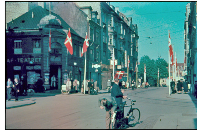
Nørregade set fra hjørnet af Guldsmedgade