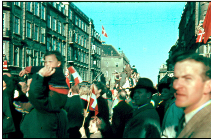
Rådhuspladsen set mod Regina-krydset