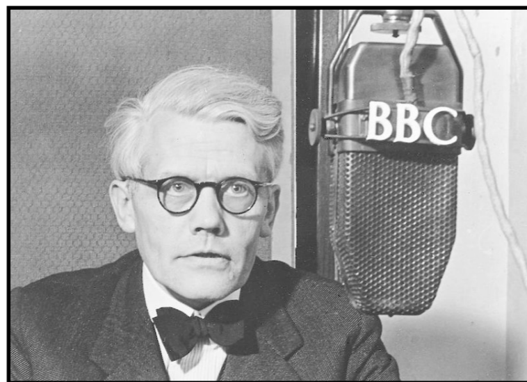
John Christmas Møller under en radiotale til Danmark fra BBC i London

sin stemme høre i BBC's udsendelser til Danmark. Frit Danmark udgav et illegalt blad af samme navn og dannede grupper i de fleste af landets større byer. Skønt angiveligt tværpolitisk var organisationen og bladet ledet af kommunisterne ud fra tanken om en folkefrontsstrategi, hvor det gjaldt om at mobilisere