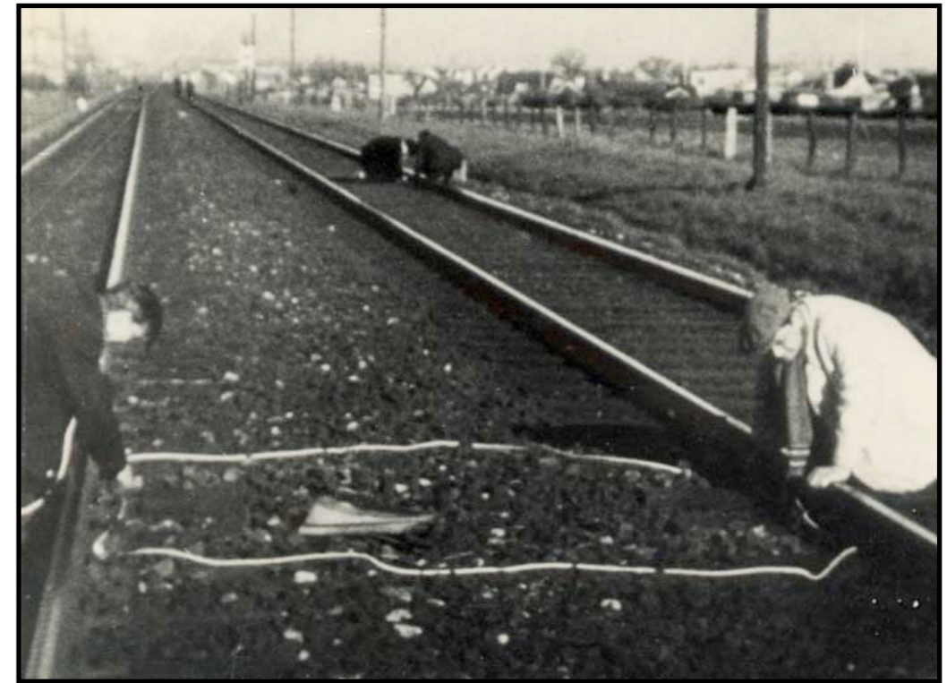
Jernbanesabotage 11. april 1945 ved Glostrup. Sabotagen blev gennemført, men anledningen var også at tage fotografier af aktionen. De vigtigste tyske tog kørte i Jylland – ikke på Sjælland

Trods tendensen til opløsning var Danmark dog fortsat i forhold til det øvrige besatte Europa at sammenligne med et ordnet samfund – ikke mindst på landet, hvor de voldsomme forandringer ligesom i de foregående år ikke havde den store indflydelse.