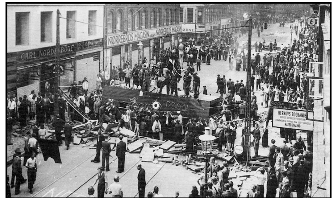
Barrikader på Nørrebro under folkestrejken 1944

forhandlinger med såvel Werner Best og Frihedsrådet og formåede af førstnævnte at få nogle indrømmelser til københavnernes, hvilket til sidst førte til strejkens ophør.