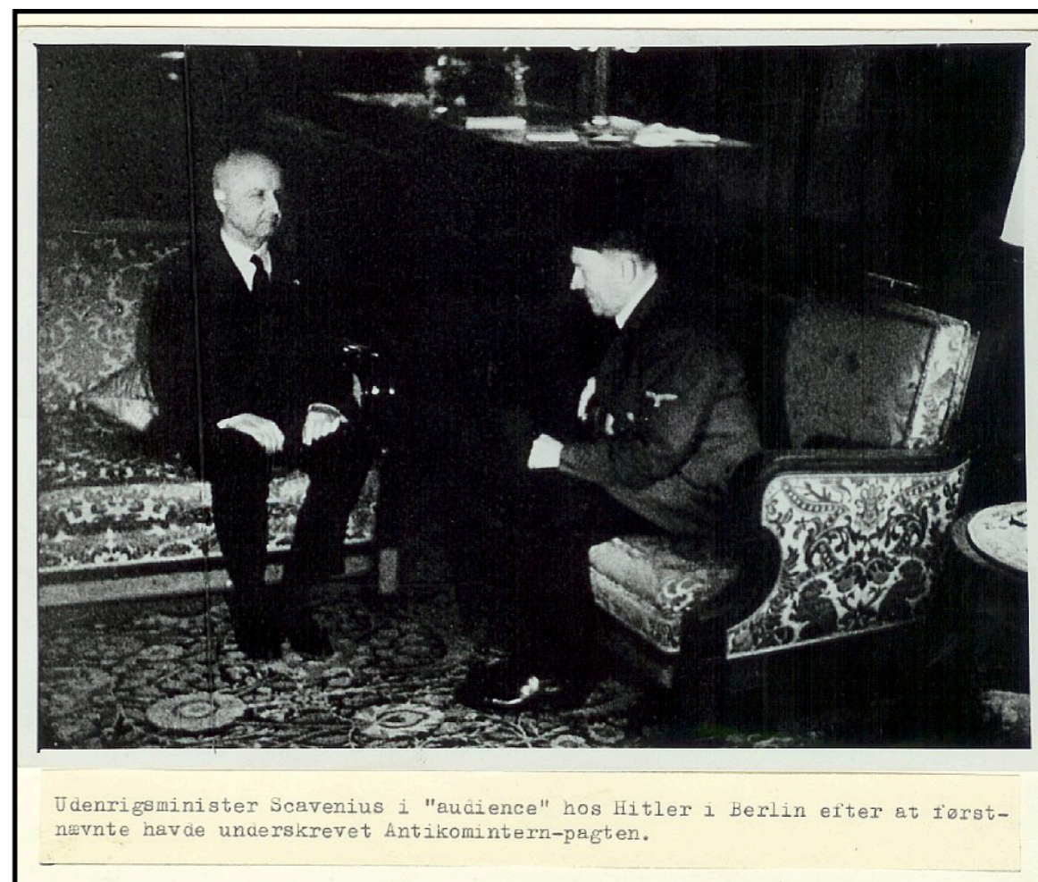
Udenrigsminister Scavenius i "audience" hos Hitler i Berlin efter at førstnævnte havde underskrevet Antikominternpagten.