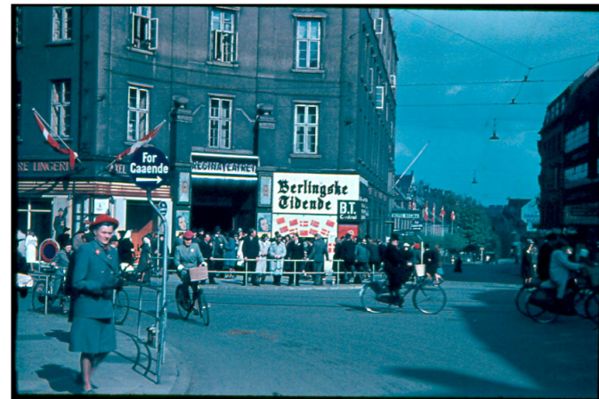
Regina-krydset set mod Sønder Allé