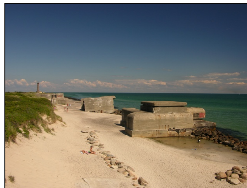
Bunkere ved Skagen.

svære arbejdsløshedsproblemer i besættelsens første år. Det skulle dog blive bedre. Besættelsesmagten satte store befæstningsarbejder i gang – især på den jyske vestkyst. Arbejdet blev udført af danske arbejdere og virksomheder. I 1943-44 tog arbejdet til med en beskæftigelse i visse perioder på over 50.000. Sammen med de titusinder af danske arbejdere, der fik arbejde i Tyskland, var befæstningsarbejdet en væsentlig faktor bag den næsten fulde beskæftigelse, som blev opnået i 1943-44. Som vanligt ved militære besættelser betalte staten for de tyske besættelsestroppers forbrug samt for befæstningsanlæggene. Midlerne blev hentet fra den såkaldte Værnemagtskonto i Nationalbanken, der sammen med Clearingkontoen finansierede det tyske forbrug.