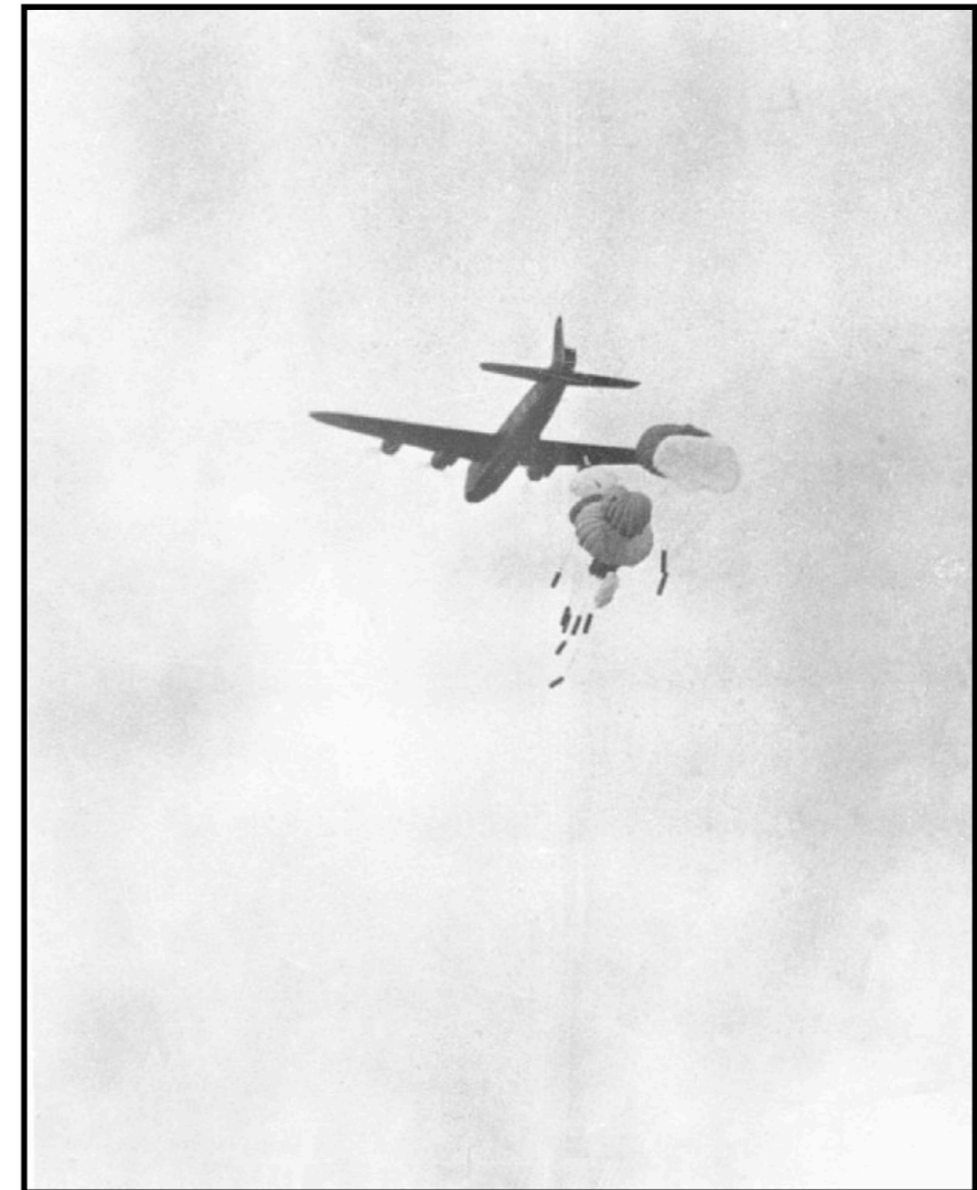
Engelsk bombefly nedkaster containere ved Højris på Mors. August 1944