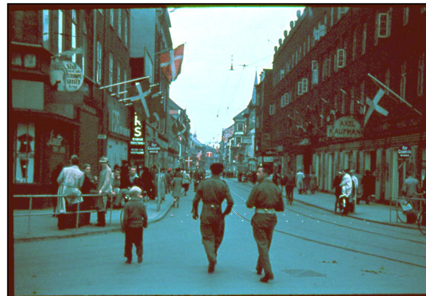
Søndergade set fra Sønder Allé (Reginakrydset) mod Østergade