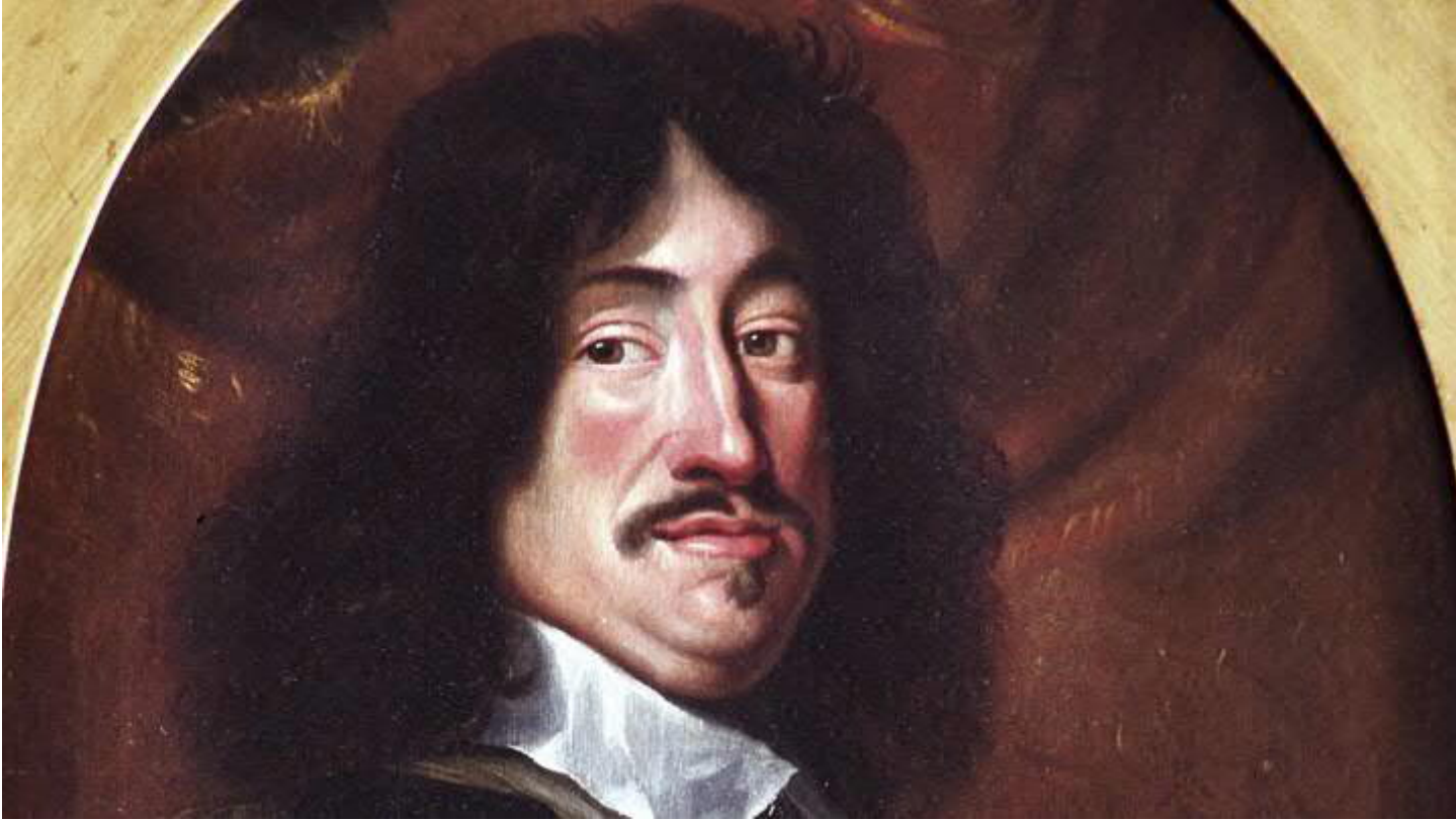
Maleri fra Karel van Manders.

Trods manglende penge indledte han endnu en krig mod Sverige, som var Danmark langt overlegen. Det endte med ydmygelse, hvor Danmark blandt andet måtte afstå Skåne, Halland og Blekinge.