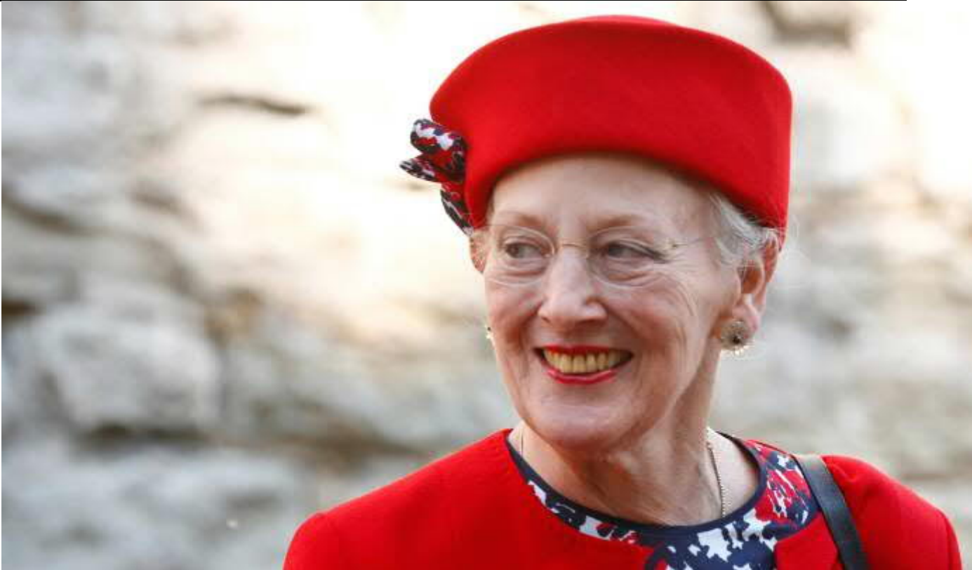
Fotograferet i Estland 15. juni 2019.