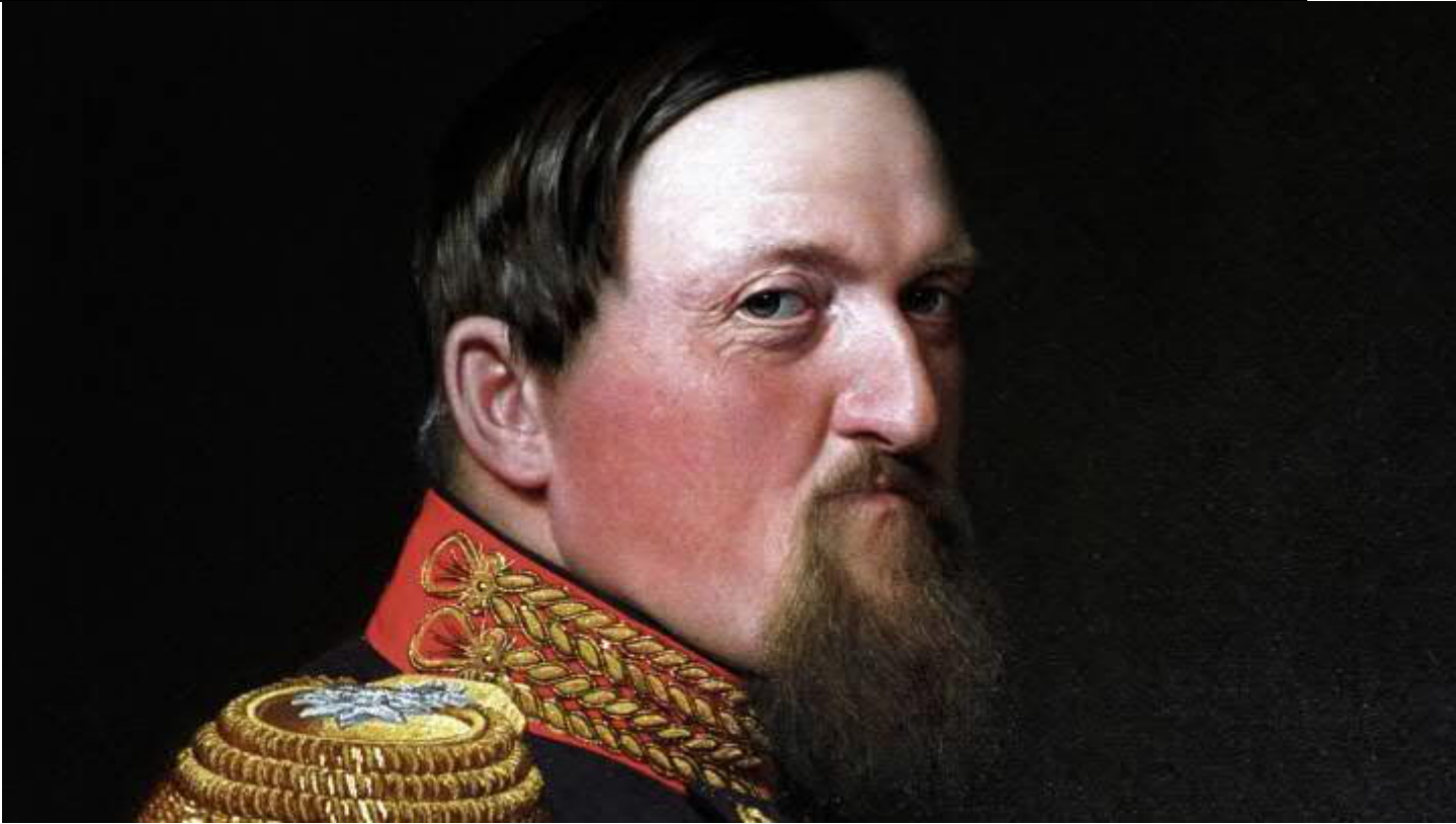
Malet af Vilhelm Gertner.