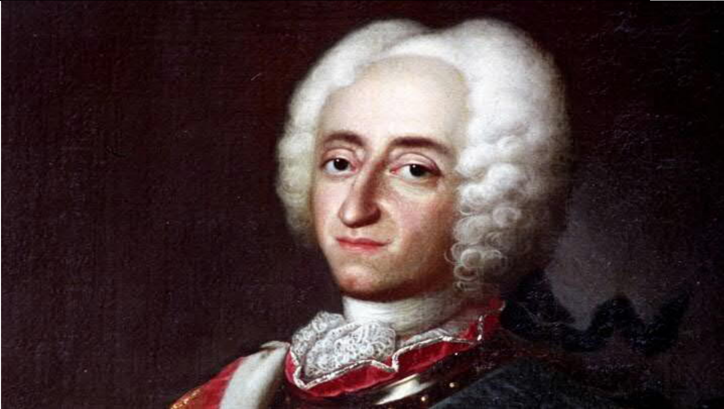
Malet af J.S. du Wahl.