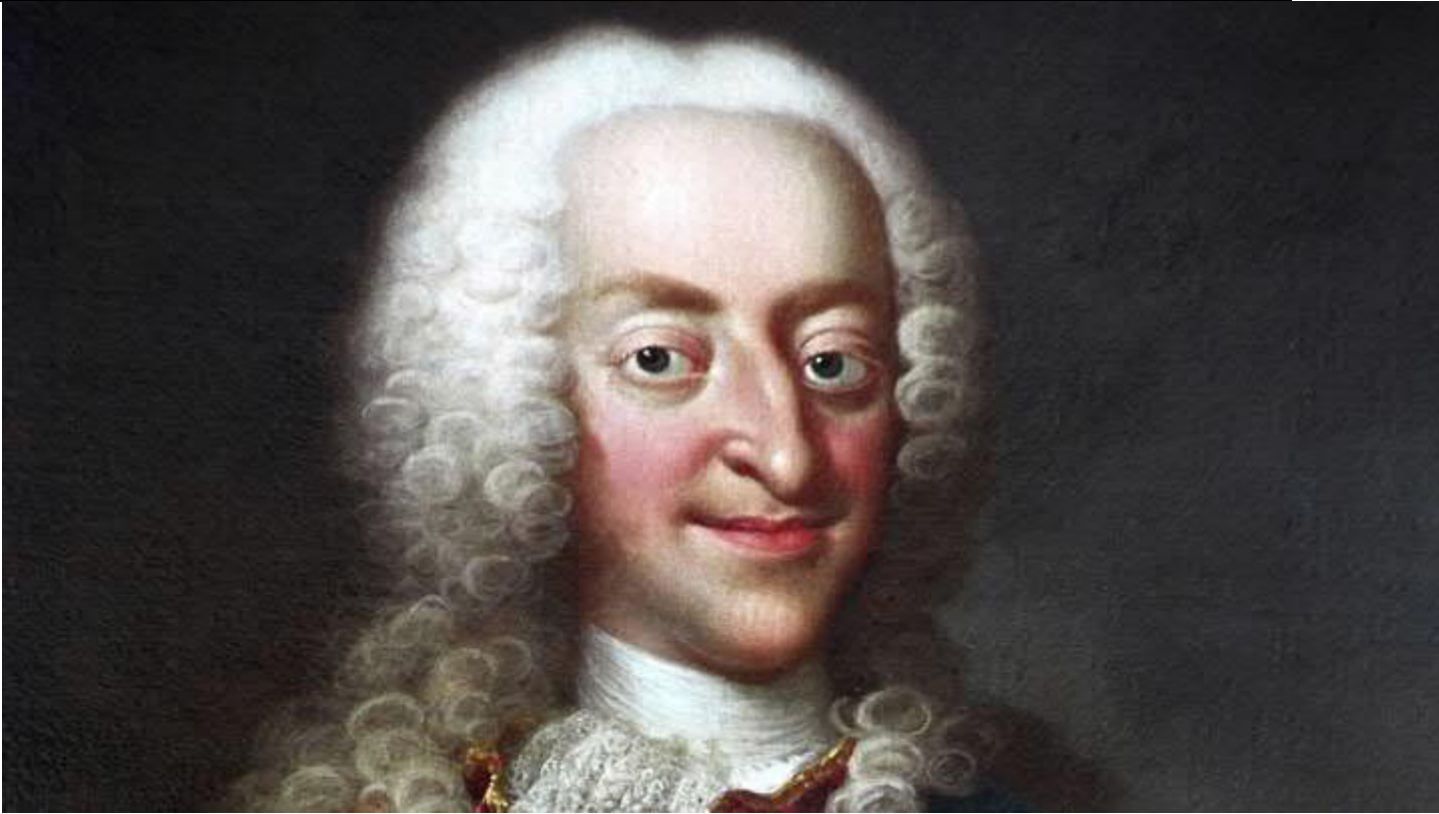
Malet af J.S. du Wahl.

Den første konge i flere generationer, der slet ikke var i krig. Han brugte alligevel masser af penge på blandt andet slotsbyggerier som eksempelvis Christiansborg Slot og det lille jagtslot Eremitagen i Dyrehaven nord for København. Pengene fik han især via Øresundstolden, der var en særdeles indbringende forretning.