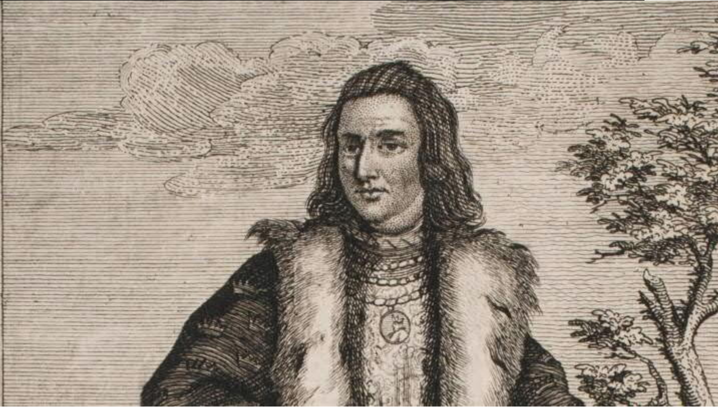
Kobberstik af Jonas Haas.