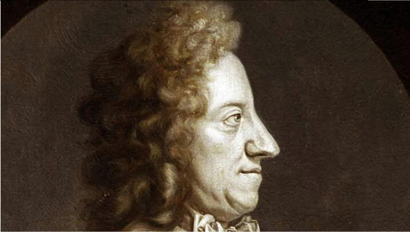
Malet af Abr. Wuchters.