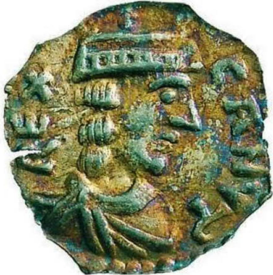
Møtfund.

Jyderne udpegede Knud som konge, men også Svend og Valdemar blev i de 11 år anset som konger. I et forsøg på at gøre alle tilfredse fik Knud Sjælland, Svend Skåne og Valdemar Jylland, men da dette skulle bekræftes ved et møde i Roskilde, blev Knud slået ihjel af Svend og hans mænd. En episode, der siden har været kendt som Blodgildet ved Roskilde.