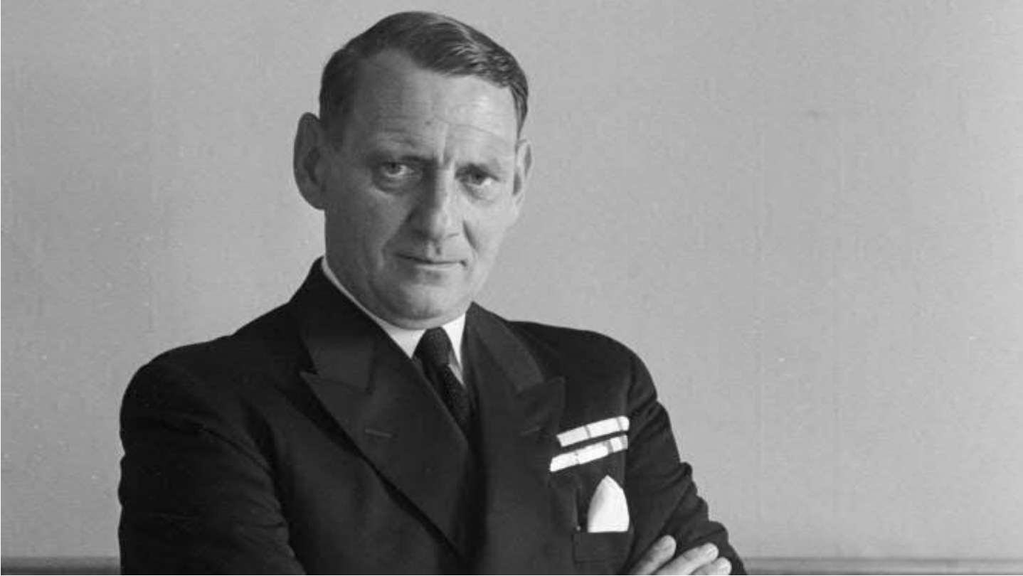
Portræt af kong Frederik 9.