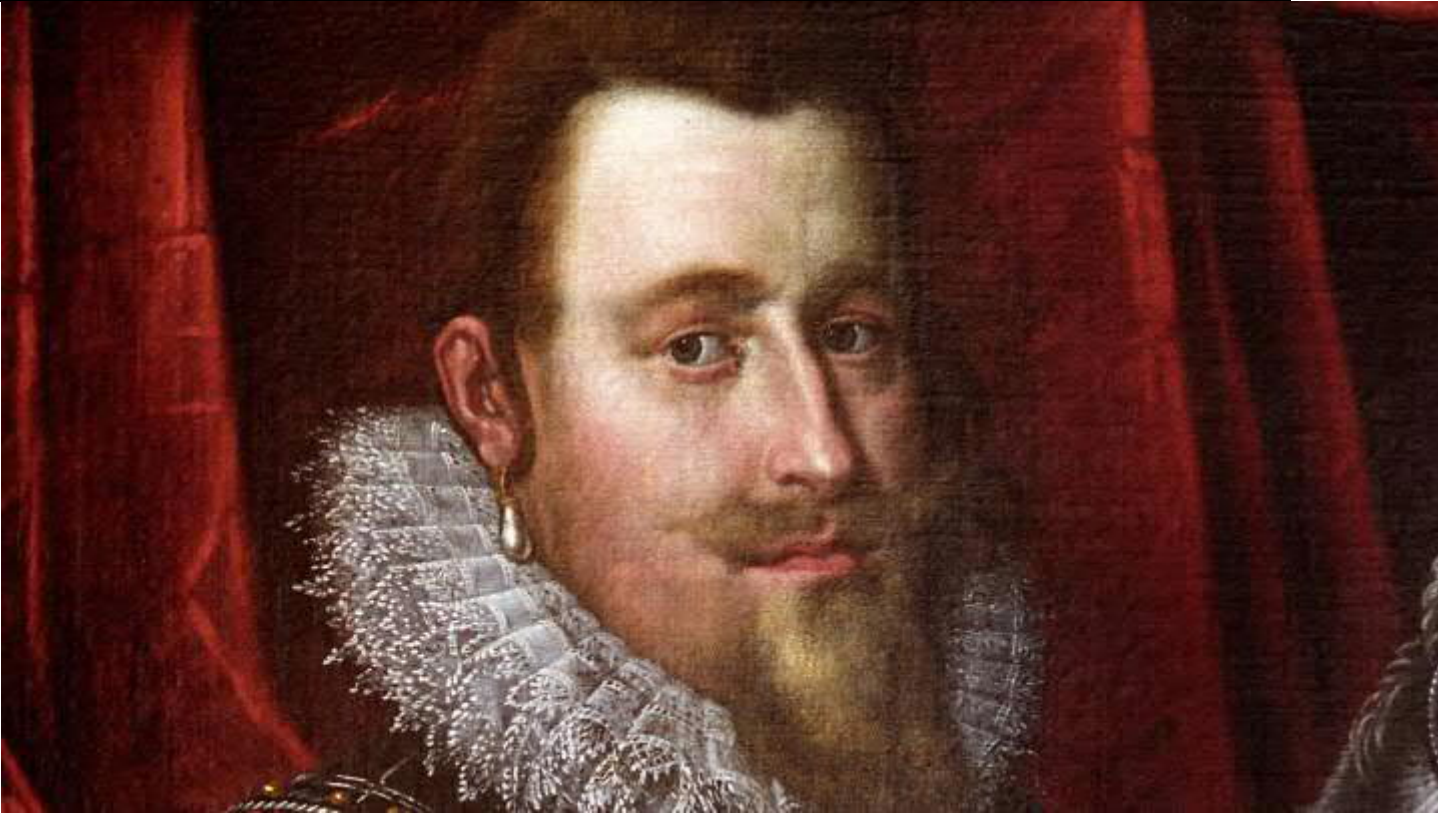
Malet af Peter Isaacsz.