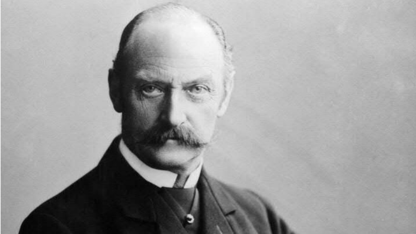
Portræt af kong Frederik 8.

I hele 43 år var han kronprins uden at få lov til ret meget af sin far. Han er også den regent, der har indtaget tronen i den højeste alder, idet han var 63 år, da han blev regent. Fik derpå kun godt seks år som regent.