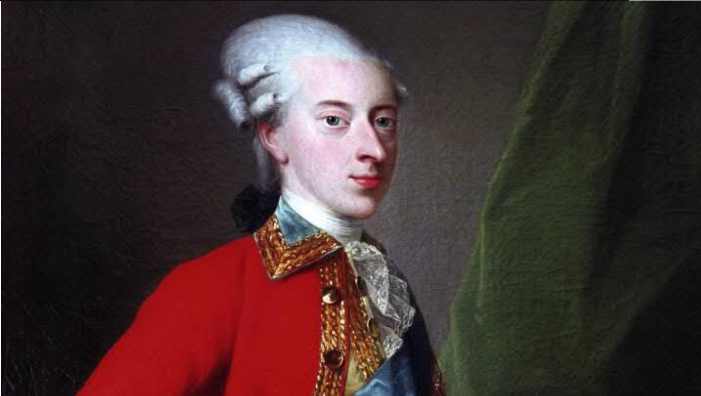
Malet af Jens Juel.