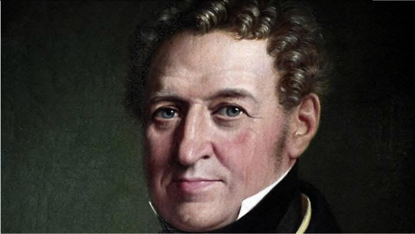
Malet af W.N. Marstrand.