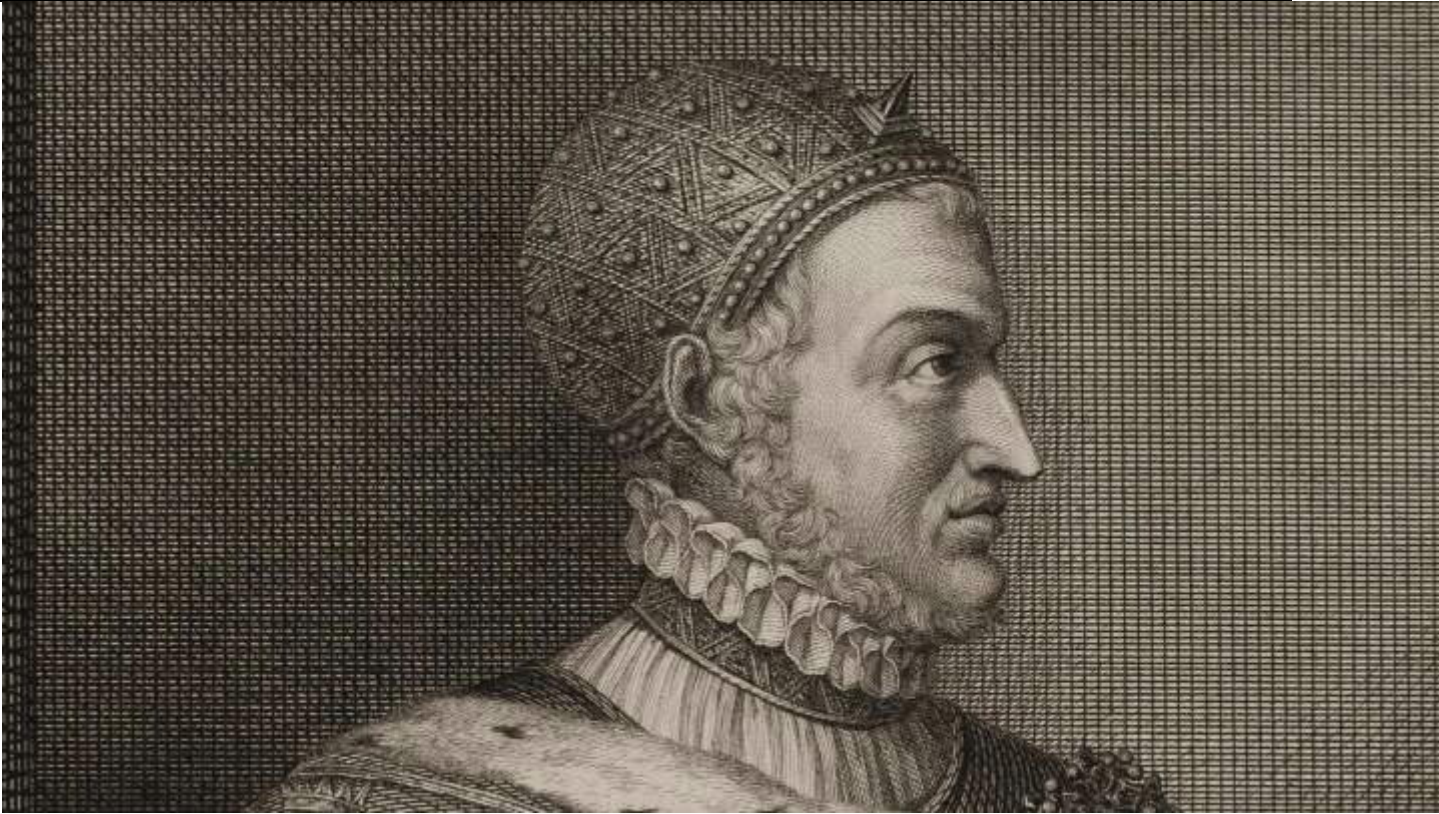
Kobberstik af Johan Martin Preisler.

Som den yngste af Christian 1.s sønner var det slet ikke meningen, at han skulle være konge, men blev altså pludselig hevet ind som afløser for Christian 2., som endda forsøgte at genvinde kampen med en vis opbakning rundt omkring i landet. Men Frederik 1. fik støtte af den berømte feltherre Johan Rantzau, som trak sig sejrrigt ud af den.